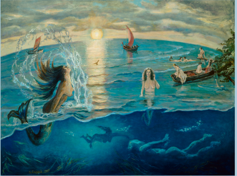
Русалки. 2007 г.