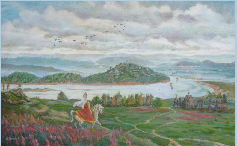
За горами, за долами Земли Русские. 2013 г.