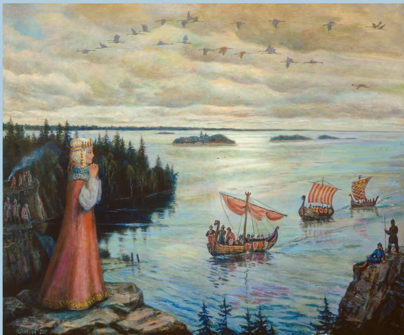
Умила Новгородская встречает сыновей: Рюрика, Трувора и Сенеуса. 2009 г.