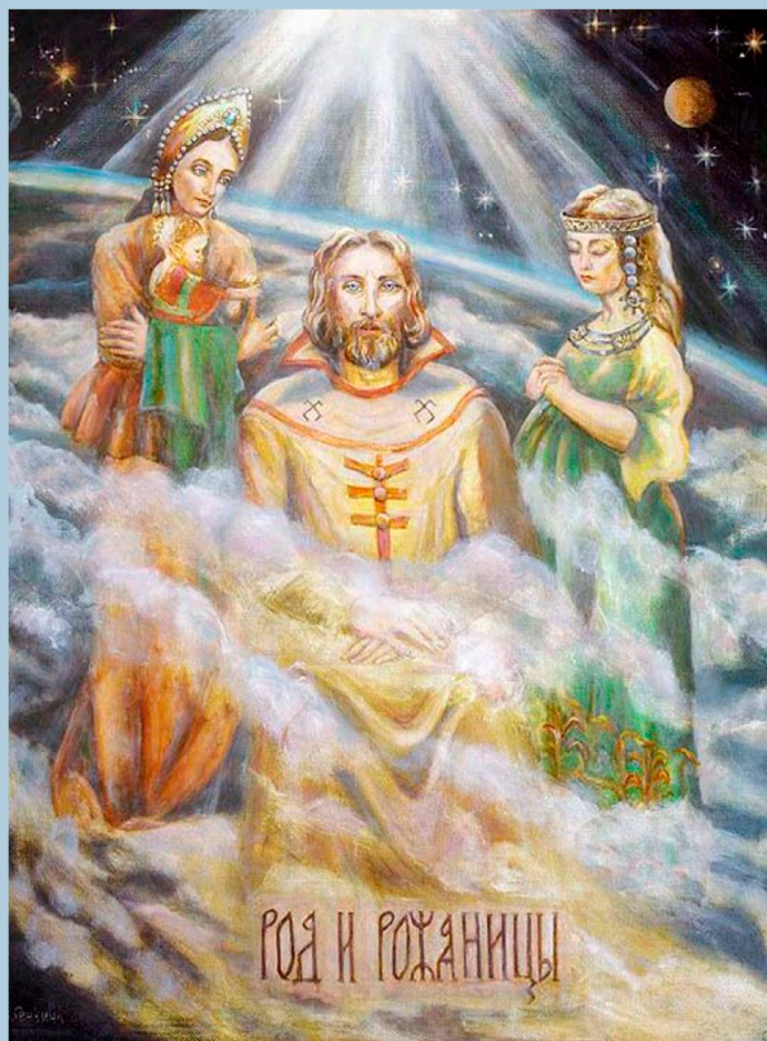
Род и Рожаницы. 2012 г.