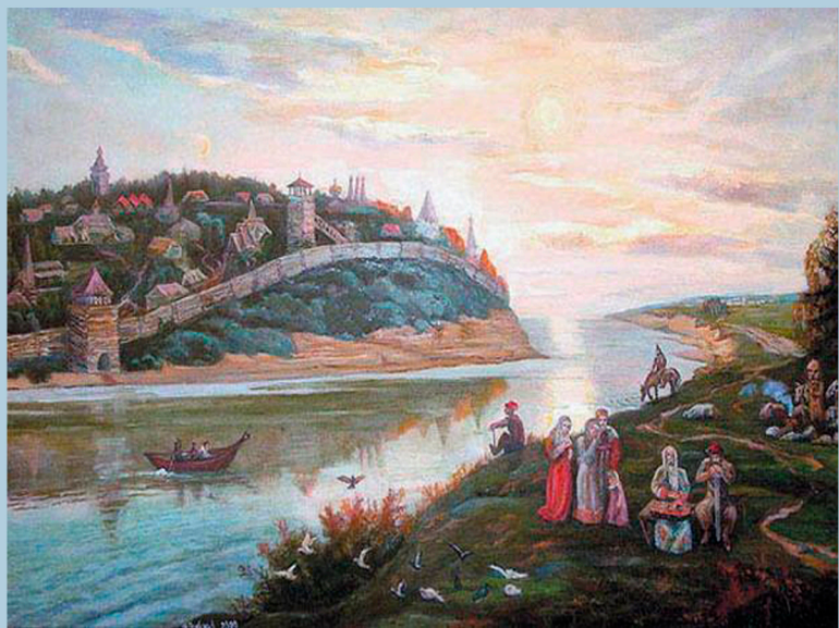
Русь древнейшая. 2009 г.