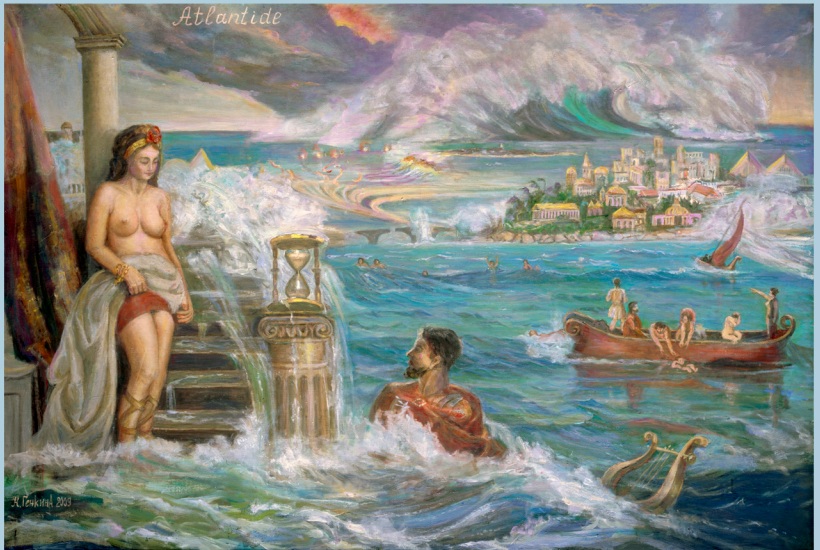
Атлантида перед гибелью. 2010 г.