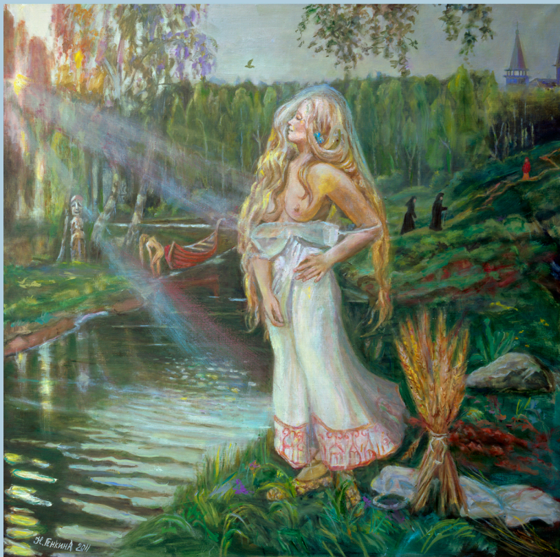
Весна языческая (Кострома). 2011 г.