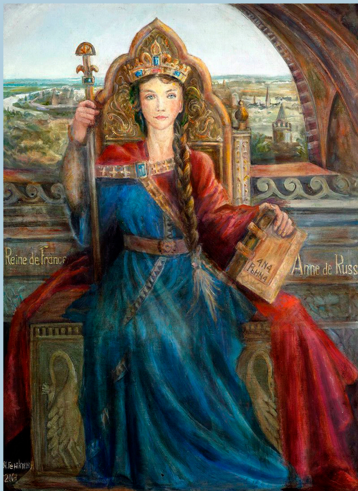
Анна Ярославна, королева Франции. 2014 г.