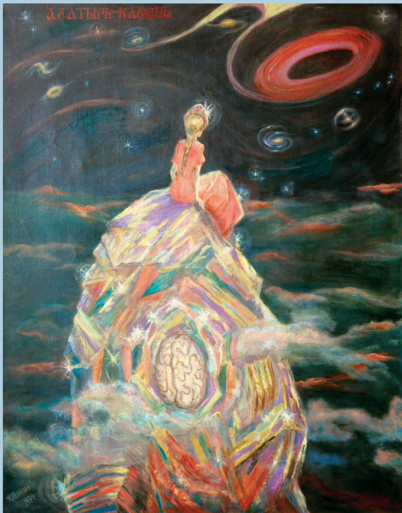
Алатырь - камень. 2007 г.