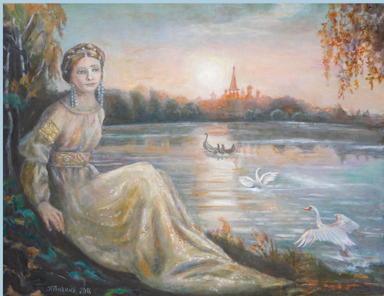
Лада-II. 2016 г.