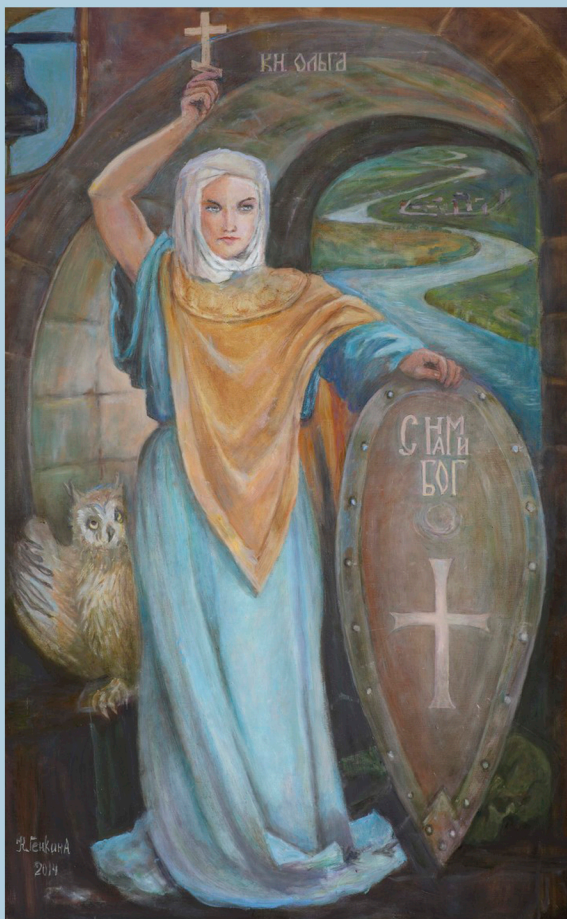
Княгиня Ольга. 2014 г.