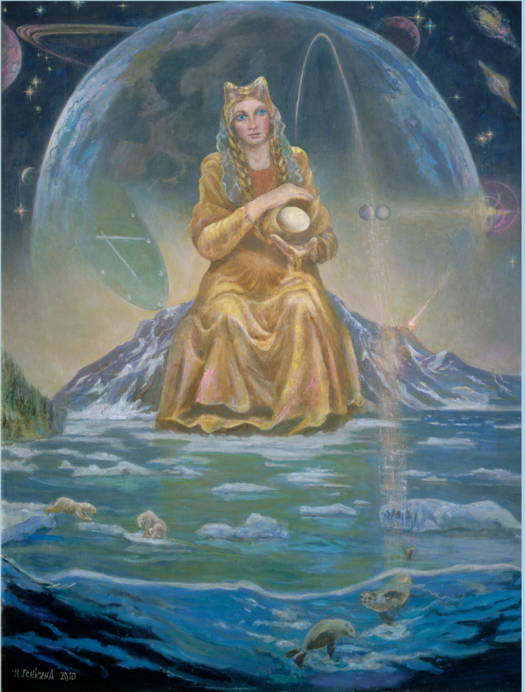
Праматеръ Гипербореи. 2010 г.