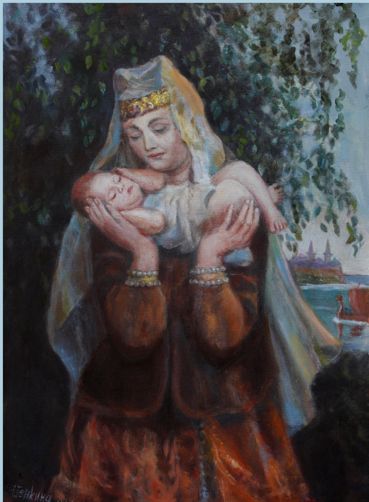
Славянская мадонна. 2012 г.