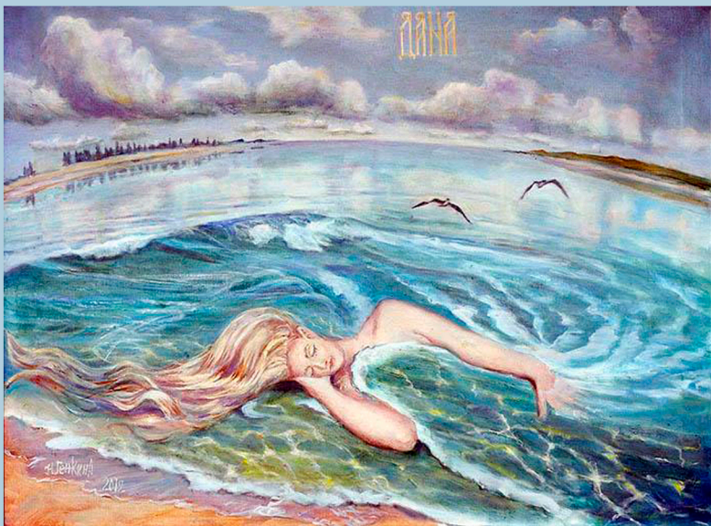
Богиня рек и воды Дана. 2012 г.