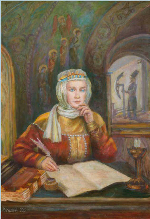
Русская княгиня - летописец, 2012 г.