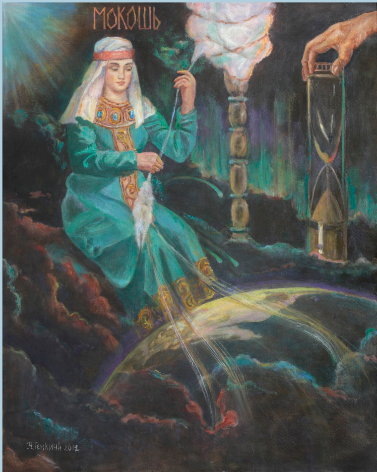
Мокошь - II. 2012 г.